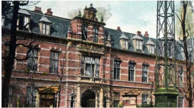
Ketelhuis WG gaat voor lokale, aardgasvrije 'Ketelhuishwarmte'